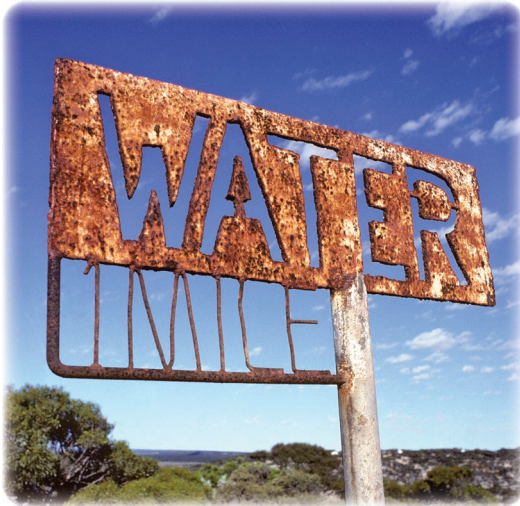
Ci-contre Désert de Nullarbor Australie.

Depuis le milieu des années 1980, la pollution du fleuve Jaune a été multipliée par deux en Chine. Couplée à la croissance du trafic fluvial, la contamination des eaux a provoqué la disparition du dauphin du Yang Tsé, également appelé dauphin de Chine.