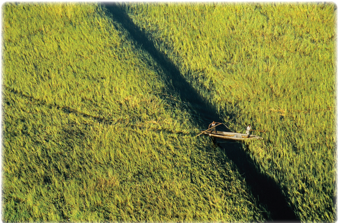
A droite Delta de l'Okavango Botswana.

Moyen de pression, la question hydrique conditionne en partie les espoirs de paix au Proche-Orient, région marquée par son aridité. L'approvisionnement d'Israël dépend essentiellement du Jourdain et de ses affluents. Leur protection est cruciale pour l'Etat hébreu. A plusieurs reprises, les Israéliens ont bombardé barrages et canaux de dérivation des fleuves Hasbani au Liban et Yarmouk en Syrie,