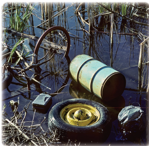
Ci-contre Pollution des zones humides Brenne France.

produits, constitué, entre autres, de matières organiques biodégradables. Déversées dans une rivière, ces dernières sont consommées par des microorganismes, qui se développent et se multiplient. Ces bactéries vont respirer la faible quantité d'oxygène présente dans l'eau, qui va alors diminuer au détriment des autres organismes. Chez les poissons de rivière, les truites qui exigent beaucoup d'oxygène seront souvent les premières à subir ce déficit. Très exigeante, la moule perlière ne se reproduit quasiment plus en France et fait l'objet d'un programme de sauvegarde.