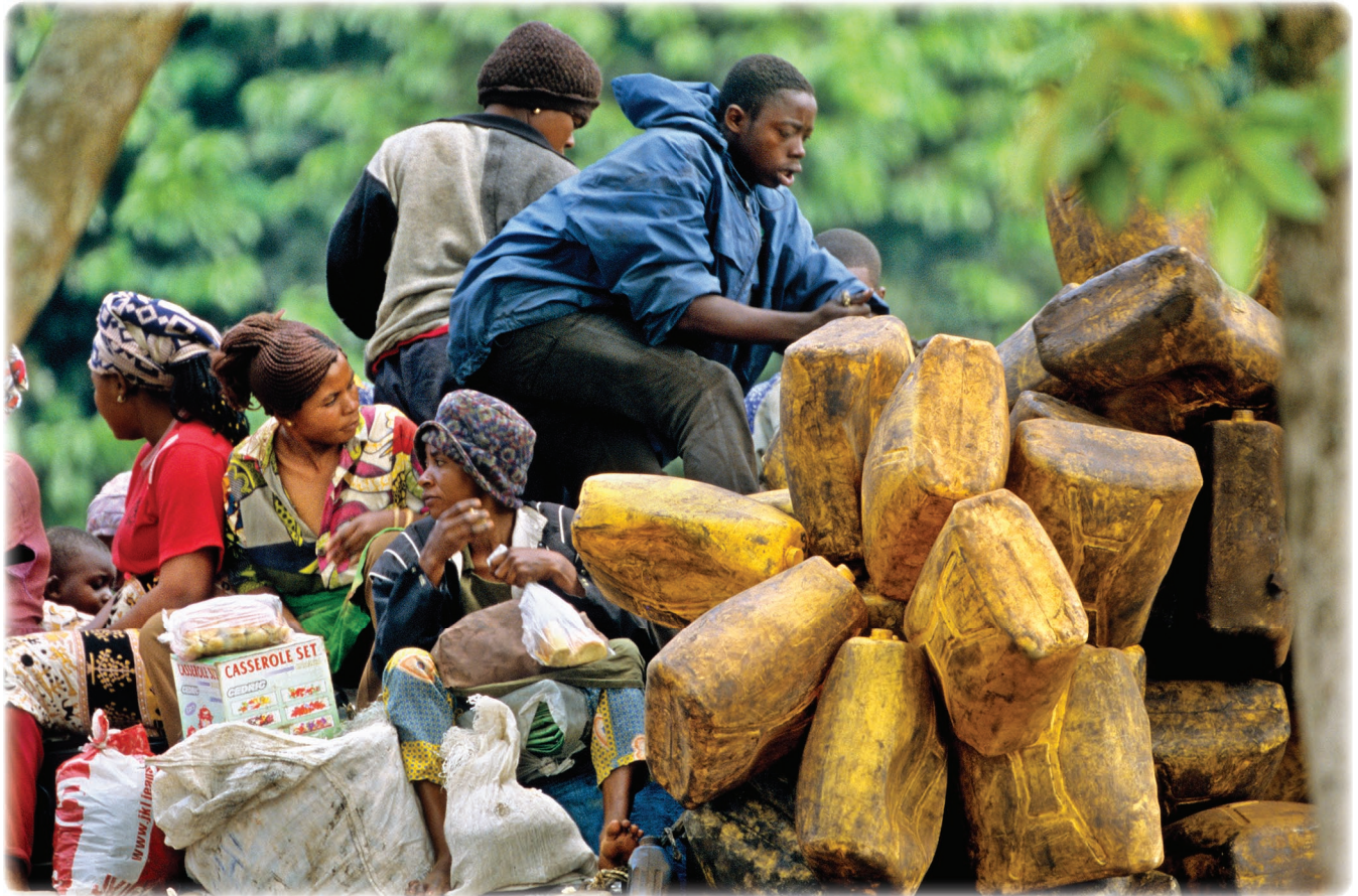
Ci-dessus Approvisionnement en eau potable Congo Afrique.

des infrastructures onéreux pour assainir, purifier et « potabiliser » l'eau.