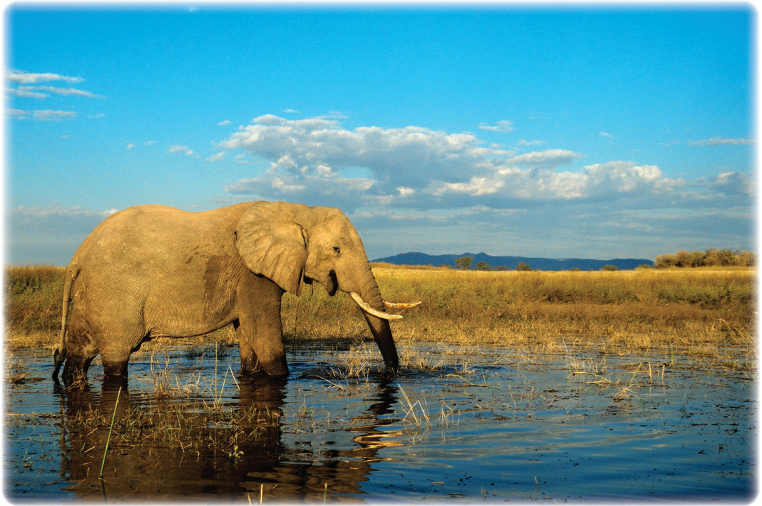
Ci-contre Éléphant d'Afrique Loxodonta africana Lac Kariba Zimbabwe.

tiques. Au niveau de l'habitat, il est possible d'économiser jusqu'à 30 % de sa consommation quotidienne en entretenant régulièrement sa robinetterie et en s'équipant d'appareils économiques. Un robinet qui fuit laisse échapper 120 litres d'eau par jour. Alors qu'il suffit souvent de changer un joint... Idem pour les réseaux de distribution publics des villes avec une surveillance