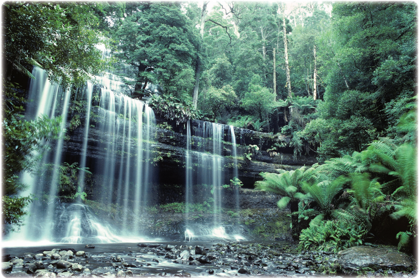
Ci-dessus Les Russel Falls Parc national de Mount Field Tasmanie.

dont les eaux alimentent le fleuve biblique.