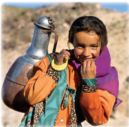
A droite Portage de l'eau Maroc.

En agriculture, une meilleure planification de l'irrigation, couplée à la mise en place de technologies modernes et économiques (recours à l'eau de pluie, par exemple), ainsi que le choix d'espèces végétales adaptées aux conditions climatiques locales, diminueraient considérablement la consommation. Ces solutions doivent également s'accompagner d'une meilleure formation des agriculteurs et d'une tarification de l'eau plus incitative.